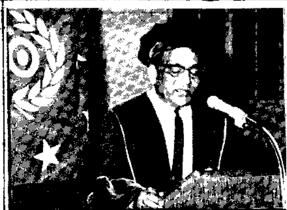
.....tijdens het uitspreken van de inaugurele rede...

Aan het einde van de deze hogelijk gewaardeerde rede, vond een receptie plaats in "Ons Huis", waarbij gelegenheid bestond de Professor en zijn familie te feliciteren.